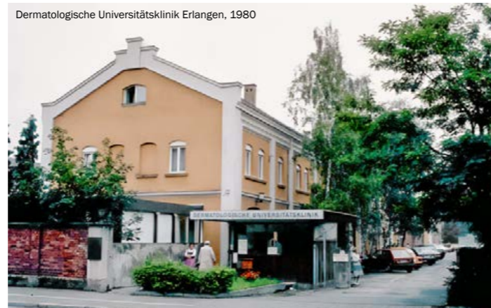
Dermatologische Universitätsklinik Erlangen, 1980